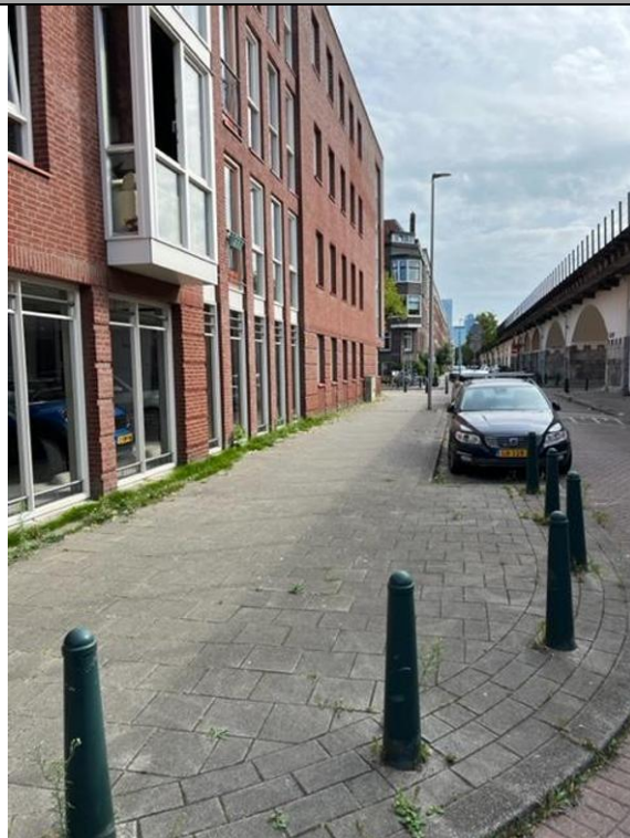
Voorburgstraat - Rotterdam